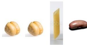
De 3 elements amb 1 repetició