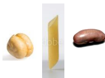
De 3 elements

8. Estaria bé treballar les seriacions. Podeu fer servir llegums, gomets si en teniu, abaloris de bijuteria, pedretes varies, taps de colors, pinces d'estendre... Us inventeu l'inici i els infants l'han de continuar: