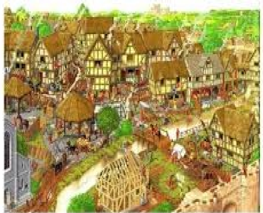
POBLE A L'EDAT MITJANA